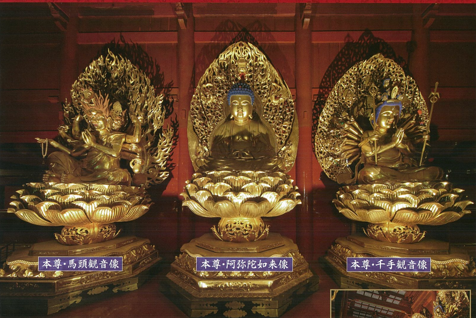
本尊・馬頭観音像