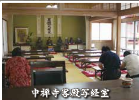
中禅寺客殿写経室