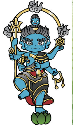
こんごうやしやみょうおう ⑤金剛夜叉明王