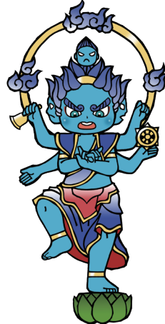
ごうざんげみょうおう ④降三世明王