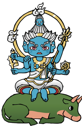
だいたくとくみょうおう ②大威徳明王