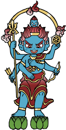
ぐんだりみょうおう ①軍荼利明王